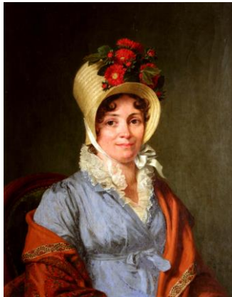
Marie-Gabrielle Capet Portrait de Sophie Gareau, Huile sur toile, 1815 N° inv. 1972.1.1 coll. Musée du château de Dourdan