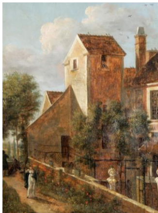
Sophie Demetz Maison Demetz, ancien hôtel des Vedye, Huile sur papier, 1 ère moitié XIX e siècle N° inv. 1971.2.2 coll. Musée du château de Dourdan